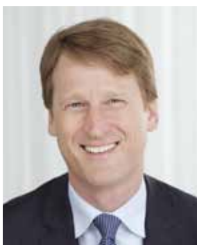
Torbjörn Magnusson IF